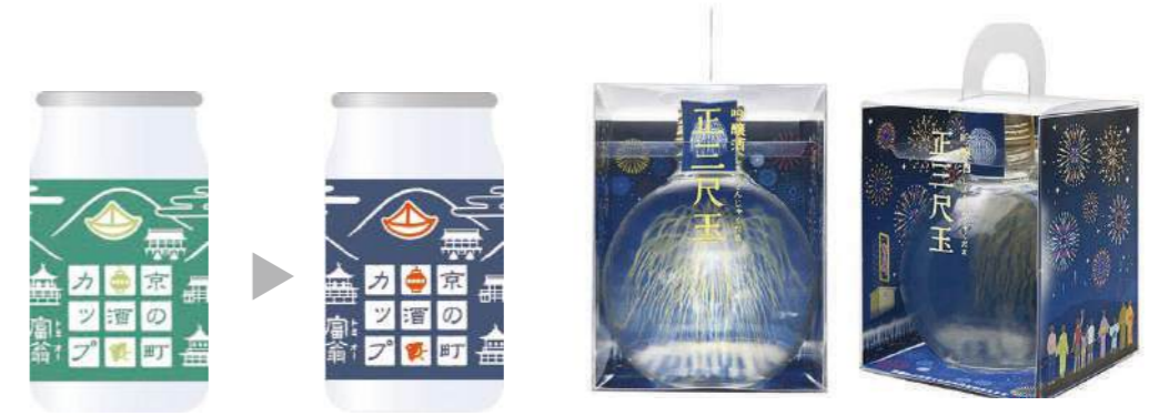
温度で色が変化するプリントびん