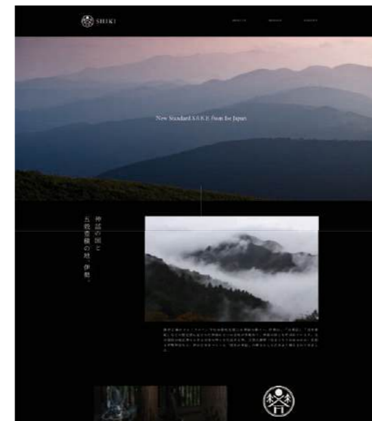
SHIKIのブランドWEBサイト

上部の円相は豊稔や森羅万象を司る太陽であり、伊勢の神話的・自然的な豊かさが調和し、響きあう酒であることを表現しています。