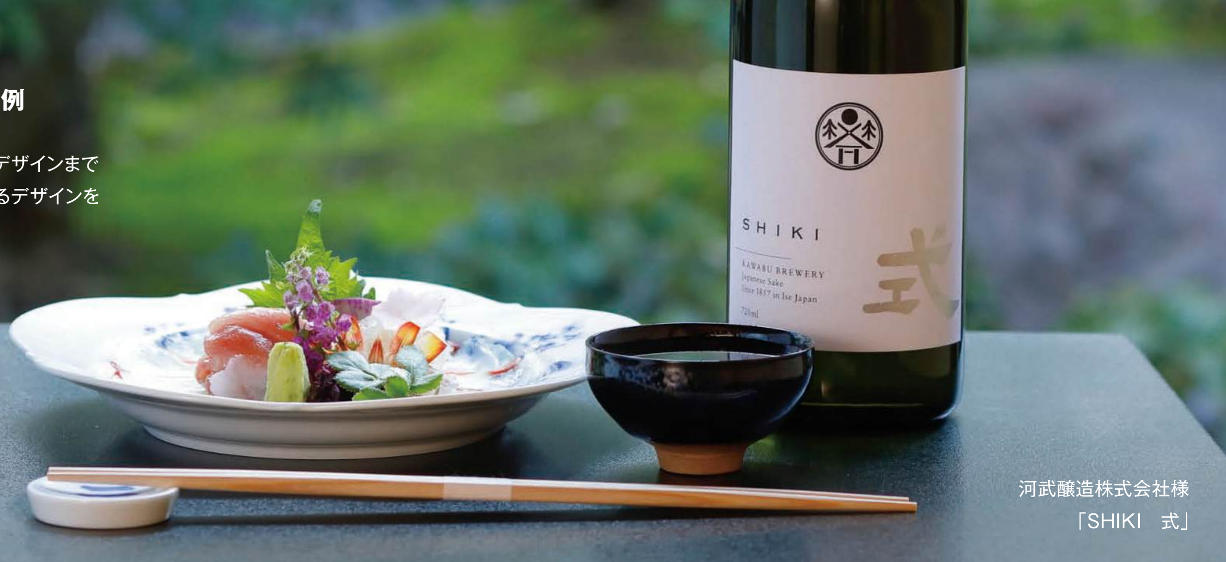
河武醸造株式会社様 「SHIKI 式」

戦略から、商品・Webサイト・店舗デザインまで 一貫通貫のサービスで統一感のあるデザインを ご提案しています。